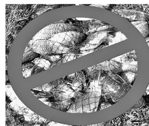
Сети до сих пор под запретом, возможно, пока.

Промысловый размер рыб определяется в свежем виде путём измерения длины от вершины головы (при закрытом рте) до основания средних лучей хвостового плавника. Также напомню, что на наших водных объектах рыбалка полностью запрещена во время нереста – с 1 по 30 мая.