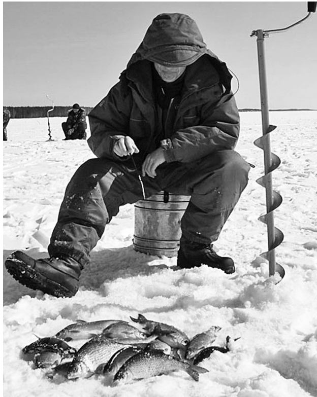
Новый закон гарантирует бесплатную рыбалку в общедоступных местах разрешёнными способами.

Новый закон вводит понятие «норма вылова». Кстати, нормы вылова уже вводились в разные периоды Российской и Советской истории и применимы для каждой области индивидуально.