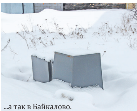
...а так в Байкалово.