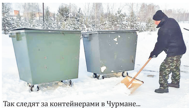
Так следят за контейнерами в Чурмане...