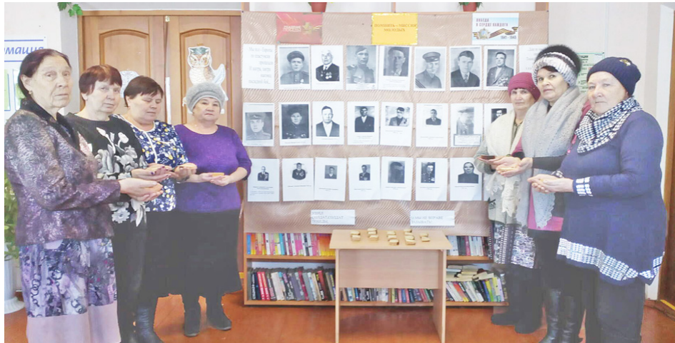
Кусочек блокадного хлеба – это напоминание о тех страшных днях, это память о том, через что пришлось пройти нашим бабушкам и дедушкам.

В день полного освобождения Ленинграда от фашистской блокады по всей России прошли мероприятия, посвященные этой дате. Всероссийская акция «Блокадный хлеб» открыла Год памяти и славы. Мы вспомнили людей, пожертвовавших своей жизнью ради нашего мирного неба над головой. Акция напомнила нам о трагедии целого города, которая развернулась среди общего горя Великой Отечественной войны.