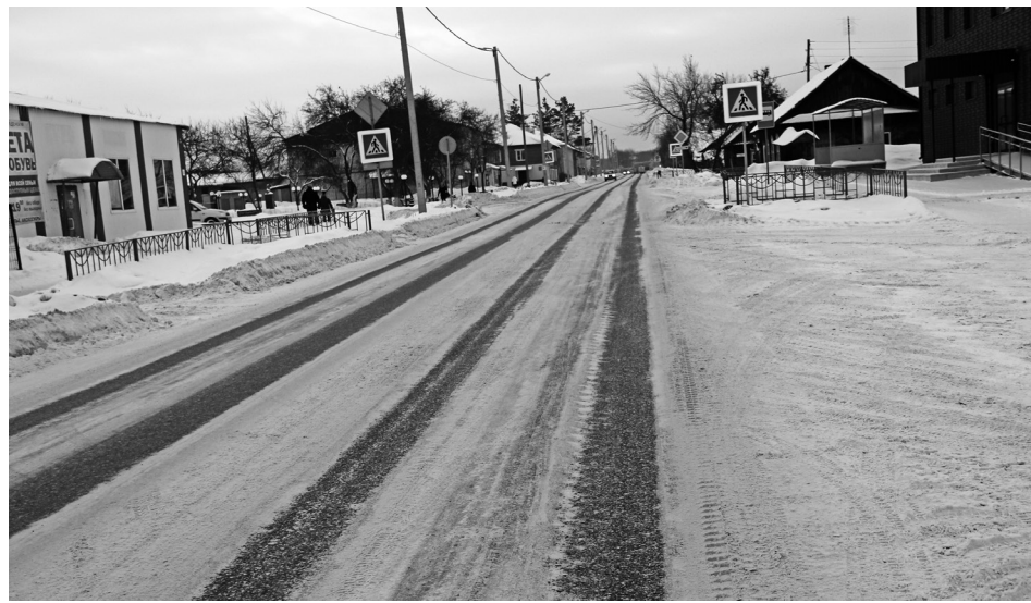
Главная проблема на дорогах зимой — колеи.